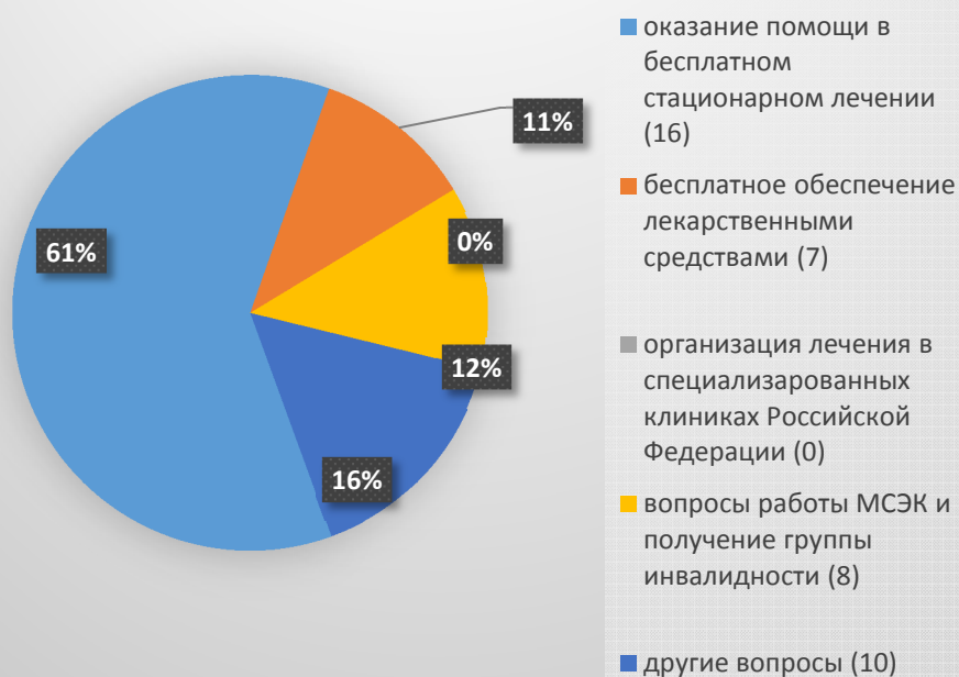
I квартал 2018 года