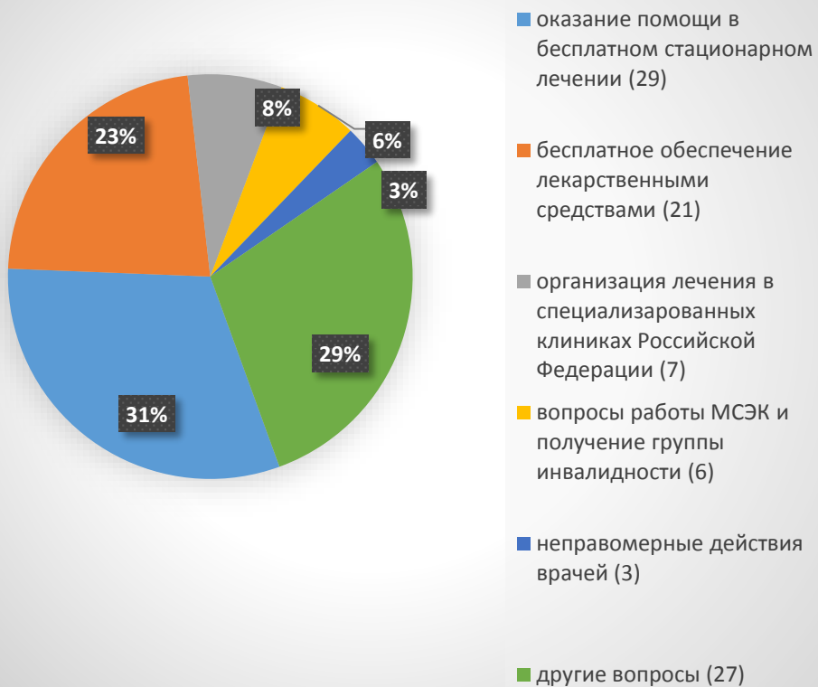
за 9 месяцев 2019 года